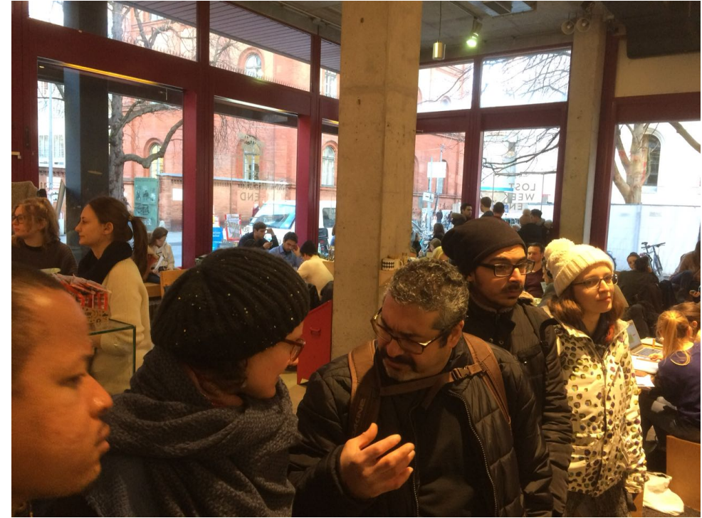
Lost Weekend Café: veganes Studentencafé an der Schellingstraße