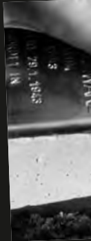
Vor unserer Ha