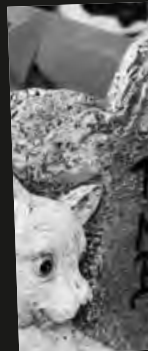
Sitz, Platz, Aus!